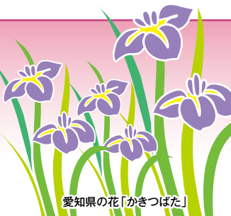
愛知の花「かきつばた」

発行所：(公社)愛知県防犯協会連合会 名古屋市昭和区円上町26番15号 愛知県高辻センター 2階 (052) 871-2110