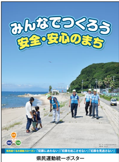
県民運動統一ポスター

この運動は、県民一人一人が防犯意識を高め、県民総ぐるみの安全なまちづくり活動を広く県民運動として推進し、犯罪を起こさせない環境作りに取り組むことにより、安全に安心して暮らせる社会の実現を目指すものです。